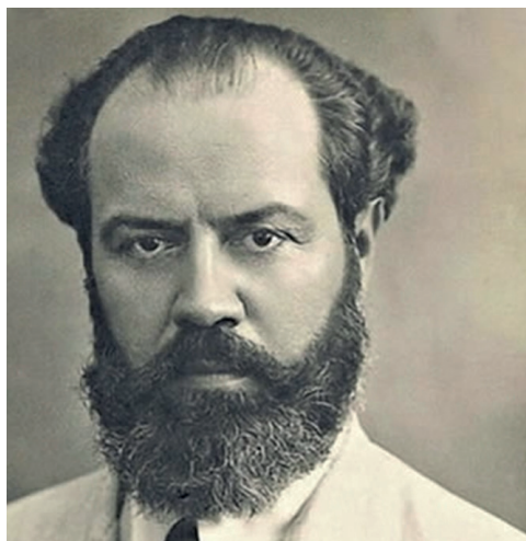
Aparício Torelly, o Barão de Itararé

Aparício Torelly era jornalista e político. Filiado ao Partido Comunista Brasileiro (PCB), usava o título nobiliário de Barão de Itararé, proclamando-se “O único Barão da República!”. O baronato era uma pitoresca referência, pois reportava a uma batalha que jamais ocorreu na história do País: a Batalha de Itararé (1930). O Barão era muito espirituoso em tudo o que fazia. Seu jornal, um bem humorado crítico do Estado Novo de Getúlio Vargas, chama-se “A Manhã”, para rivalizar com o sério matutino “A Manhã”, de Mário Rodrigues, pai de Nelson Rodrigues e Mario Filho (sim, aquele que dá nome ao Maracanã). Certa vez a redação d’A Manhã foi empastelada por fascistas. No dia seguinte, Aporelly, outro de seus pseudônimos, pendurou na porta uma tabuleta com os seguintes dizeres: “Entre sem bater”. Era também um farsista incorrigível: