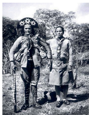
Corisco e Dadá