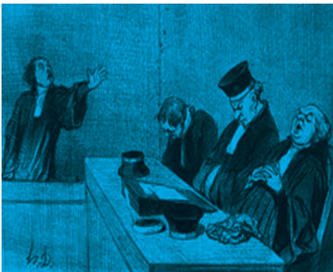
A Tribuna do Advogado como objeto vintage

Participando de um ciclo de debates promovido pela Comissão Especial de Direito Tributário do Conselho Federal da OAB, realizada em meio ao isolamento determinado pela pandemia (26/05/20), o presidente do Superior Tribunal de Justiça (STJ), Ministro João Otávio de Noronha, enaltecendo o êxito das sessões virtuais desenvolvidas pela Corte, manifestou opinião no sentido de que no modelo adotado está assegurada a participação dos advogados nos julgamentos, pois ficam conectados no ambiente virtual aos ministros. Não que S. EX a nutra muito gosto por ouvir as sustentações orais dos causídicos, mas assegura: - “Leio os memorias”. Aliás, tampouco S. EX a . tem paciência para apreciar pareceres muito longos, os quais, promete que lerá “depois que se aposentar”. ( https://www.youtube.com/watch?v=q7cdOE-7cLWM&feature= ).